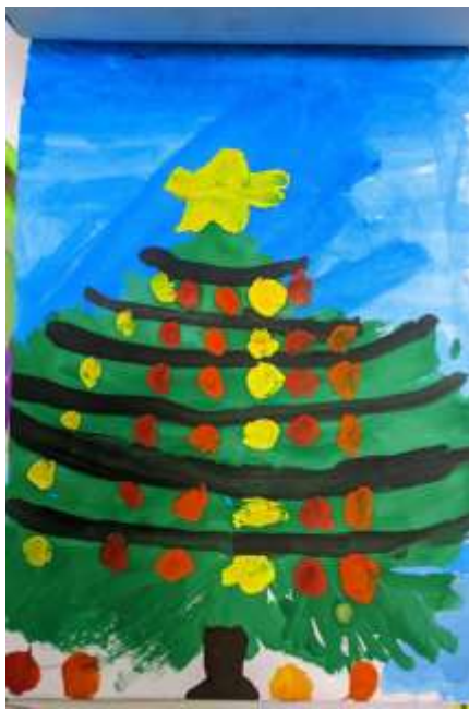
Даня, 9 лет